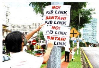
Section 19 residents have put up banners along Jalan Harapan to object to the proposal for a new highway, the Petaling Jaya Dispersal Link.

THE movement control order that took effect on March 18 has been tough for everyone and there have been no winners. For business operators, the loss of income, staff layoffs and other issues have been a challenge. For residents, the loss of income, staff layoffs and other issues have been a challenge. For residents, the loss of income, staff layoffs and other issues have been a challenge.