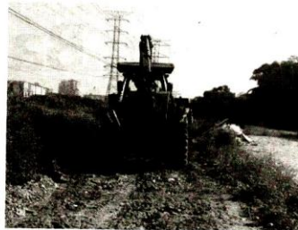
ANTARA tapak semeian di Jalan Sungai Buloh-Shah Alam, Selangor yang dirobohkan pihak berkuasa.