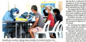
Healthcare workers taking down details of residents before the Covid-19 test at SJK (K) Chua Moh in Petaling Jaya Old Town after certain areas were placed under enhanced MCO.

Old Town market Markets in Petaling Jaya came under the spotlight this year as Covid-19 dominated headlines. Pasar Besar Jalan Othman, the oldest market in the city, was among the first five sites to record Covid-19 cases. In May, 1,200 traders were required to undergo Covid-19 tests after the authorities shut the market. Twenty-six positive cases were reported with a majority linked to foreign workers. A lockdown resulted in the same month, affecting 2,960 residents and others. Although Petaling Jaya Old Town comprised houses in Sections 1, 2, 3 and 4, only 100 houses in Section 2, 40 premises in Section 3 and 100 houses in Section 4 were placed under enhanced MCO. The lockdown proved difficult for people, including vendors and the disabled, whose daily routine involved getting food from restaurants.