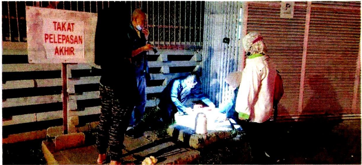
ANGGOTA JAS mengambil sampel sisa pemprosesan yang dibuang dari kilang makanan yang boleh menyebabkan pencemaran Sungai Damansara baru-baru ini.