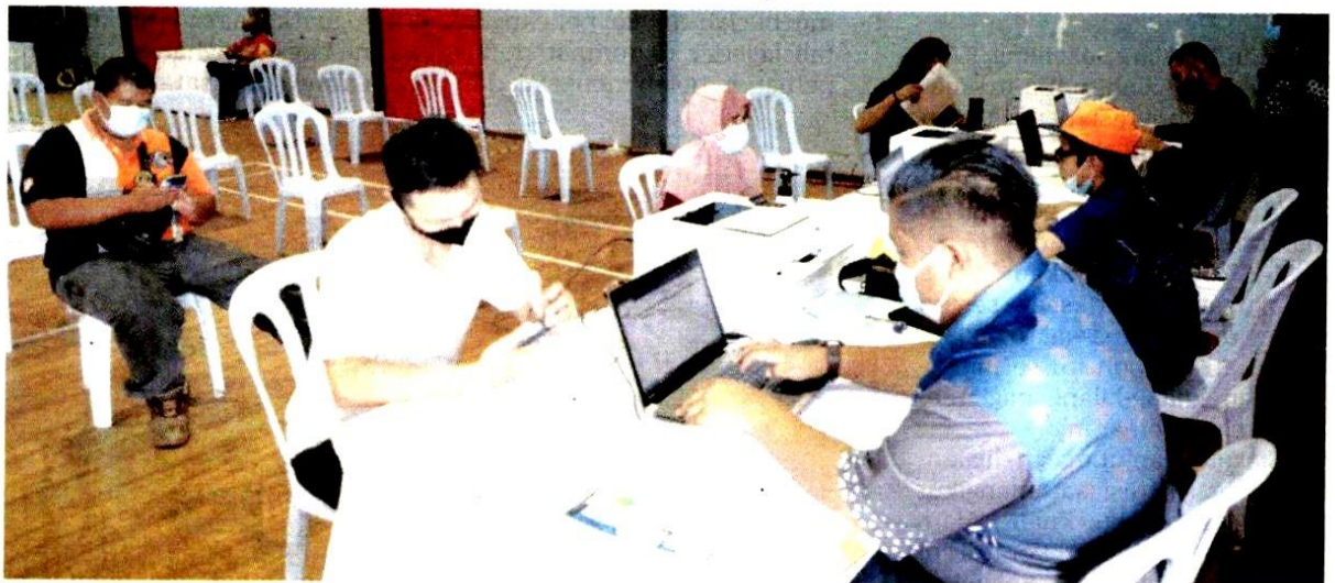
PARA penjaja memohon permit menjaja sementara di kawasan Zon Selatan, di Dewan Liparis Seksyen 31, Shah Alam baru-baru ini.

“Inisiatif permit itu secara langsung dapat memastikan para penjaja menjalankan aktiviti perniagaan dengan kebenaran dan mematuhi peraturan telah ditetapkan oleh MBSA,” katanya dalam kenyataan di sini semalam.