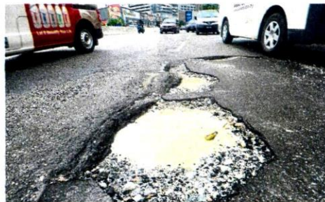
Gone to pot: Potholes seen along Jalan Klang Lama in Kuala Lumpur.

"When the width of the hole is up to 1,000mm, it will require the part of the road to be cut before it is