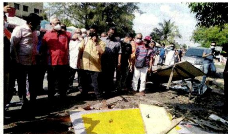
Noh meninjau struktur gerai yang dirobohkan dalam operasi itu.

Isnin lalu, Sinar Harian melaporkan mengenai tindakan MBSJ merobohkan gerai di lokasi berkenaan yang didakwa menjadi punca kepada isu kesesakan di sini.