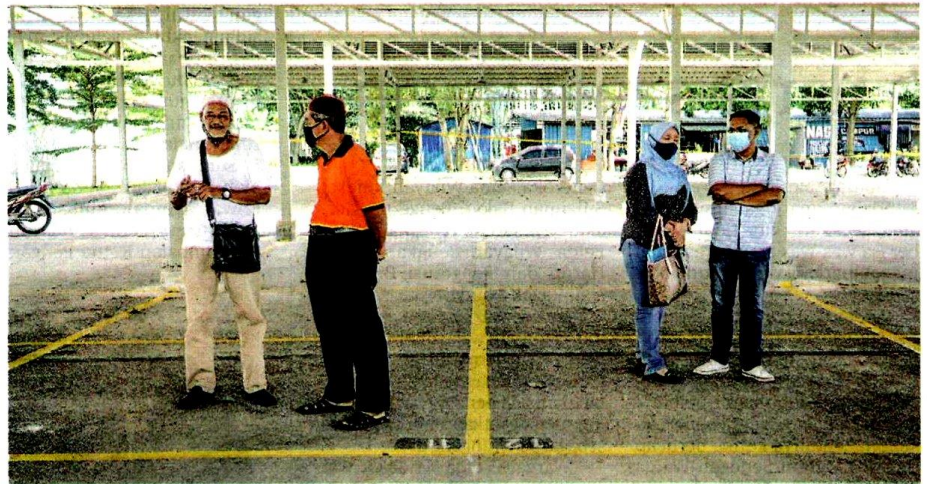
SEBAHAGIAN peniaga berdiri di tapak baharu yang didakwa tidak menepati standard semasa lawatan Noh Omar ke kawasan gerai yang dirobohkan MBSJ di Taman Puchong Permai dekat Kuala Lumpur, semalam.

atau pekak? Sepatutnya belajar dengan Wilayah Persekutuan bantu peniaga. Ini sediakan tapak pun macam tempat letak kereta,” katanya selepas melawat tapak gerai yang diroboh-