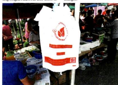
More than 160 businesses in MPS collectively contributed RM260,823 for the 20sen surcharge levied on customers.

Certain areas had to be cordoned off by barbed wires, splitting neighbourhoods into those to